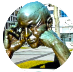
Vier Ansichten von Denkern | Denkenden